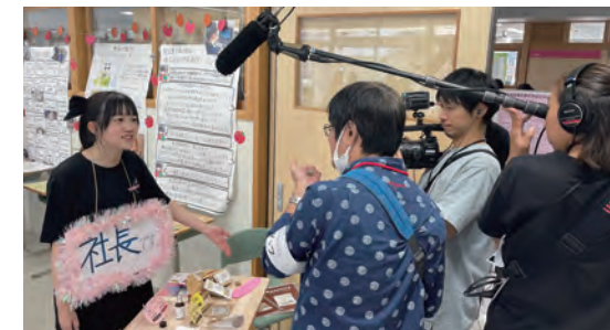
(株) Kasstoryは、食品ロスをアップサイクル商品やワークショップで問題提起