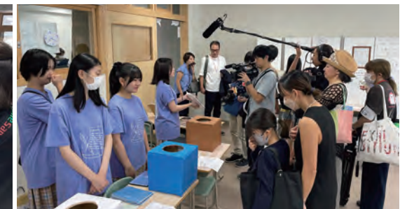
(株) Lifetimeは時間をコントロールする「ToDoノート」を開発し販売