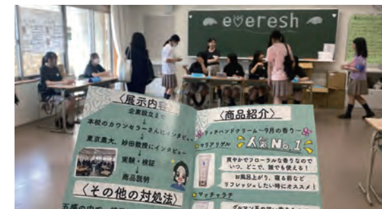
(株) evereshlは、「匂い」を使ったストレス解消法を提案